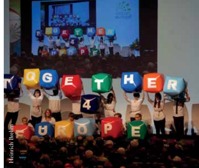
Studierende aus sechs Ländern Europas in Brüssel

Dass Verschiedenheit kein Grund für Spaltung ist, sondern vielmehr eine unschätzbare Bereicherung darstellt, haben im belgischen Löwen gut 30 Studierende aus sechs Nationen und sieben Gemeinschaften erlebt: Unter dem Titel „Face2faith in Europe“ gingen sie fünf Tage dem