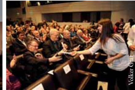
Übergabe des Manifestes

Thema Freundschaft nach. Was mit Debatten „Facebook“ begann, setzte sich in der intensiven Auseinandersetzung mit dem Freundschaftsbegriff Jesu fort und warf die – ebenfalls breit und mit Gästen diskutierte – Frage auf, wie die nachkommende Generation aus dieser Freundschaft heraus die Geschicke Europas gestalten könne. Der Geist des „Miteinander für Europa“ war in dieser Gruppe spürbar – im Gespräch, im gegenseitigen Kennenlernen, in den unterschiedlichen Gebetszeiten, die von den Studierenden selbst gestaltet wurden und eine große Breite an Spiritualitäten offenbarten, und beim intensiven Austausch, als es galt, einen eigenen Beitrag für die Großveranstaltung in Brüssel zusammenzubringen.