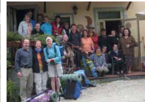
Pilgergruppe vom Franziskusweg