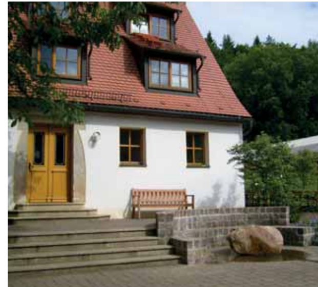
Gästehaus mit Brunnen

So stellen sich uns als Team auch immer wieder neu die gleichen Fragen. Und es kann sein, daß wir von Jahr zu Jahr andere Antworten finden. Wir überlegen z. B. wieder einmal neu, welche Inhalte wir unseren Gaben entsprechend und zum Haus passend 2014 anbieten.